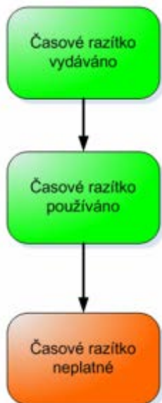
Obrázek 2: Životní cyklus časového razítka